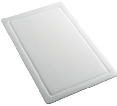
Tagliere in HPDE 8657 001