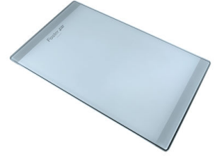
Tagliere in cristallo 8631 300