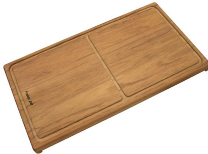
Tagliere scorrevole in legno Iroko 8643 000